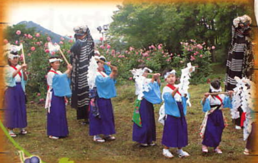
子ども達によるしながく